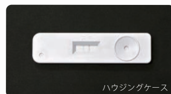
ハウジングケース

イムノクロマト試薬には、感染症、食物アレルギー、妊娠検査試薬等、様々な検査用途があります。その試薬を作製する際に用いられる、バックイングシートやカバーテープをお客様のご要望にあわせ、カスタム仕様でご提供できるようになりました。米国 G&L 社製で、創業 1978 年からこれまでに世界 40 ヶ国以上でご使用いただいているトップブランドメーカーが、打ち合わせから納入までをしっかりとサポートいたします。