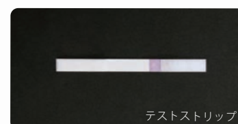
テストストリップ